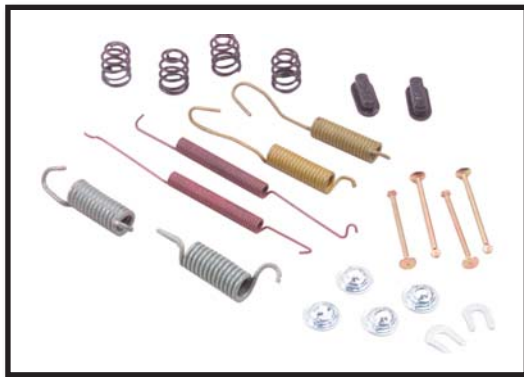
Trousse de réparation de frein à tambour #084-1452

Mazda B2300 (95- 97), Mazda B2500 (98- 01) Mazda B3000 (95- 02), Mazda B4000 (95- 01) Ford Ranger (95-00)